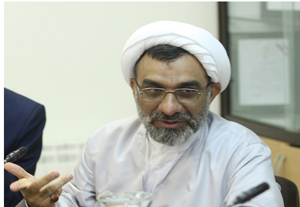
حجت الاسلام خسروپناه مطرح کرد: